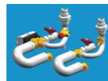
Set ventilov s cevmi HC134+EE49