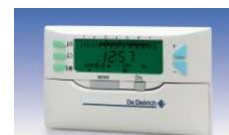
Daljinski upravljalac CDI2