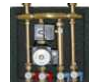
Mešalni sklop EA104