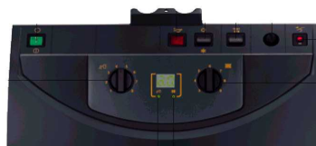
Basis - FM126