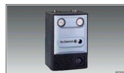
Sklop za direktni ali mešalni krog