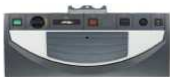
X - FM19