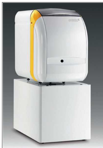
GTU 120 - oljni kotel s tovarniško nastavljenim gorilnikom in pokrovom le-tega

GTU 1200 - oljni kotel s tovarniško nastavljenim gorilnikom in podstavljenim grelnikom sanitarne vode z vgrajeno titanovo anodo, setom veznih cevi, črpalko in tipalom za grelnik