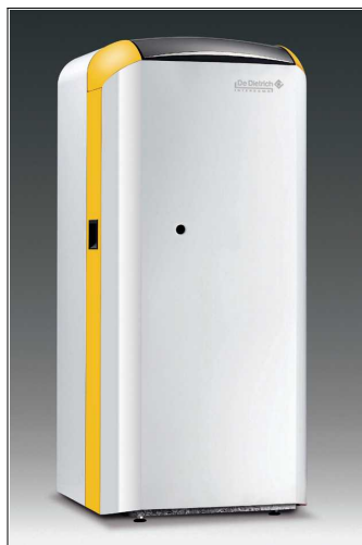
GTU 1200 V - oljni kotel s tovarniško nastavljenim gorilnikom in grelnikom sanitarne vode z vgrajeno titanovo anodo v skupnem ohišju, črpalko in tipalom za grelnik

GTU 1200 - oljni kotel s tovarniško nastavljenim gorilcem in podstavljenim grelnikom