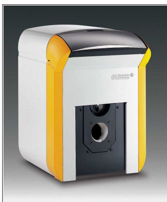
GT 120 - oljni kotel brez gorilnika

GT 1200 - oljni kotel brez gorilnika s podstavljenim 160 l ali 250 l grelnikom sanitarne vode z vgrajeno titanovo anodo, setom veznih cevi, črpalko in tipalom za grelnik