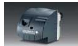
Oljni gorilnik M100 S rumeni plamen