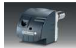
Oljni gorilnik M100 N modri plamen