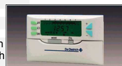
Digitalni upravljalnik CDI2