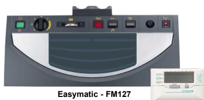
Easymatic - FM127